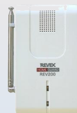
<無線アラーム装置>