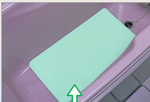
マットセンサーを浴槽に設置