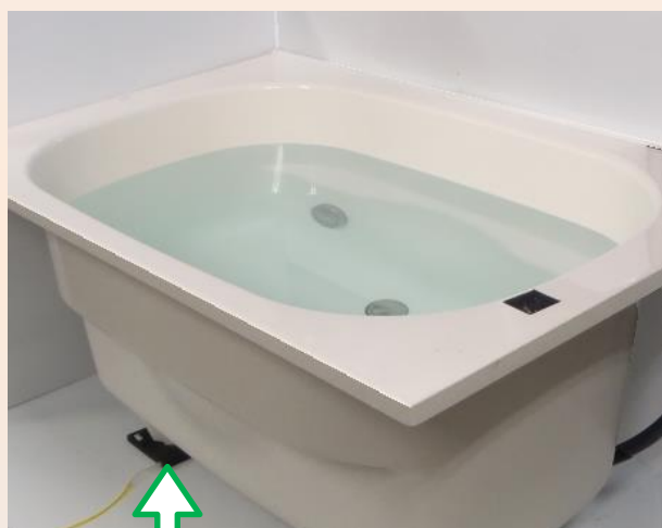
センサーを底下に設置