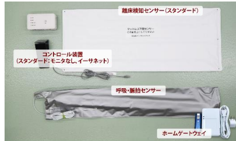
シッタープロ 個別対応タイプ