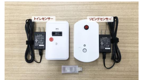
トイレセンサー／リビングセンサー