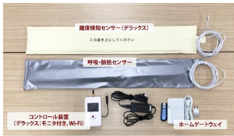
シッタープロ デラックス