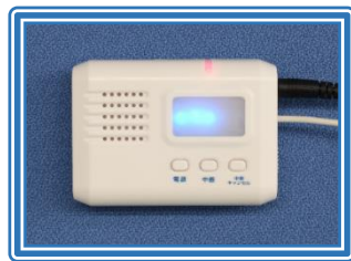
ワイヤレス受信器