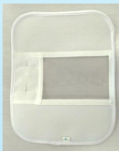
Aライン用メッシュカバー